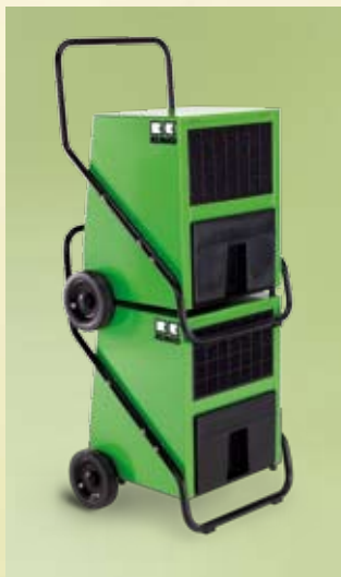
Osuszacze Remko można ustawiać jeden na drugim.

Osuszacz Remko AMT to urządzenie łatwe w obsłudze, gwarantujące stałą, bezawaryjną pracę 24 godziny na dobę.