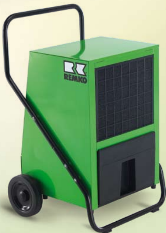
REMKO AMT 80-E