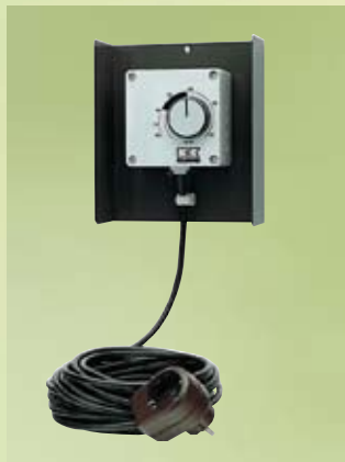
Gotowy do podłączenia, w pełni automatyczny higrostat

Osuszacze Remko idealnie nadają się do użytku w piwnicach, gabinetach, pomieszczeniach hobbystycznych i rekreacyjnych, magazynach, archiwach oraz łazienkach.