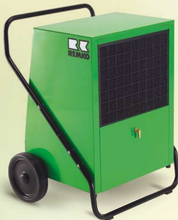
REMKO AMT 110-E