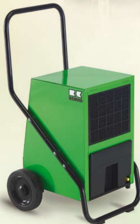
REMKO AMT 40-E